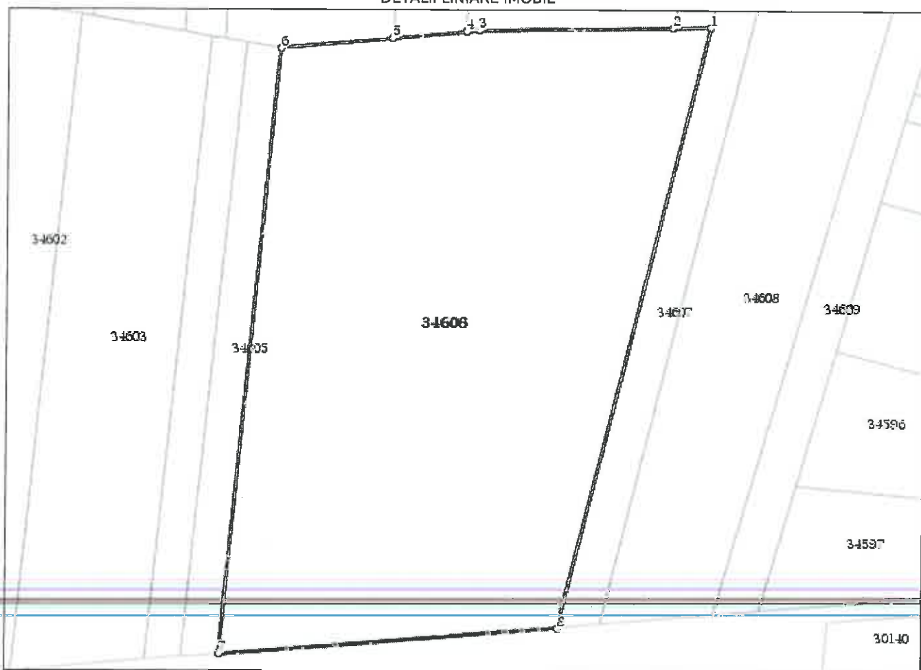
DETALII LINIARE IMOBIL

* Suprafața este determinată în planul de proiecție Stereo 70.